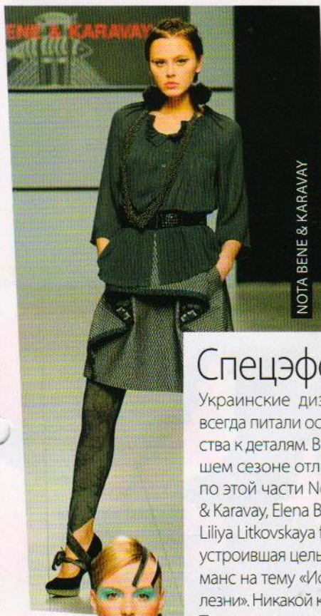
NOTA BENE & KARAVAY