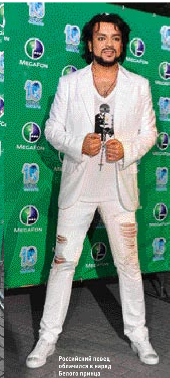
Российский певец облачился в наряд Белого принца