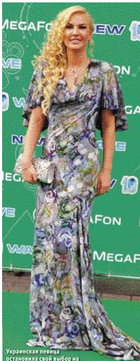
Украинская певица остановила свой выбор на беспрюгрой классике