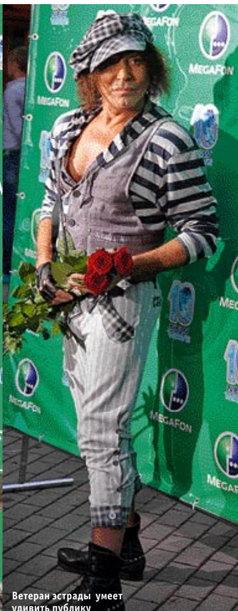
Ветеран эстрады умеет удивить публику своими нарядами